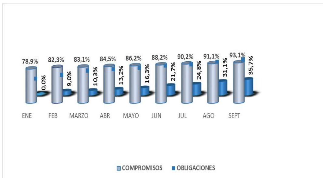
Gráfica 2 Ejecución gastos de Inversión

En la misma se aprecia que los compromisos vienen de forma ascendente toda vez que los primeros registros expedidos obedecen a las vigencias futuras autorizadas en vigencias anteriores. Igualmente, de procesos que venían en curso desde el inicio de la vigencia: